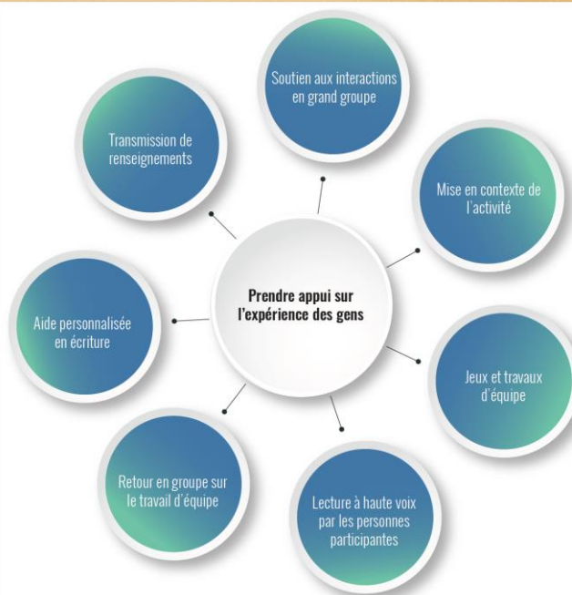
Figure tirée de Bélisle, Roy et Mottais, 2019, p. 49